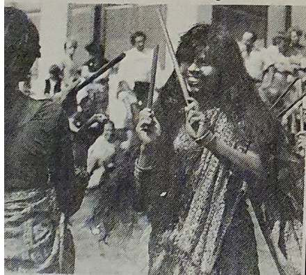
at inslag i kvinnokulturfestivalen var de här Indiska satta i Västervik. De visade upp några Indiska danser, p av käppar.

åh tjejer. Vi måste r för att höras! Så när tjejer tar i och