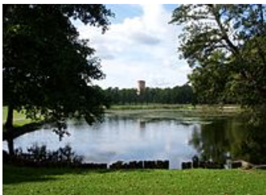
Götiska tornet med siktlinje från engelska parken, september 2011.

I samband med att Gustav III övertog Drottningholms slott år 1777 utarbetades de första planerna för en engelsk parkanläggning av Carl Fredrik Adelcrantz . I den nya parken önskade