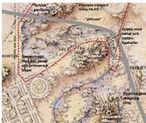
Pipers utökningsplan (röd linje).