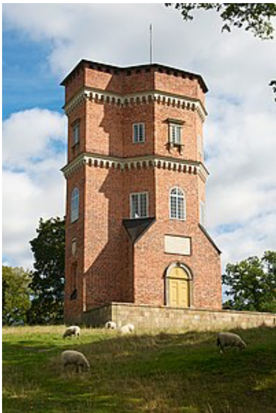
Götiska tornet, augusti 2011.